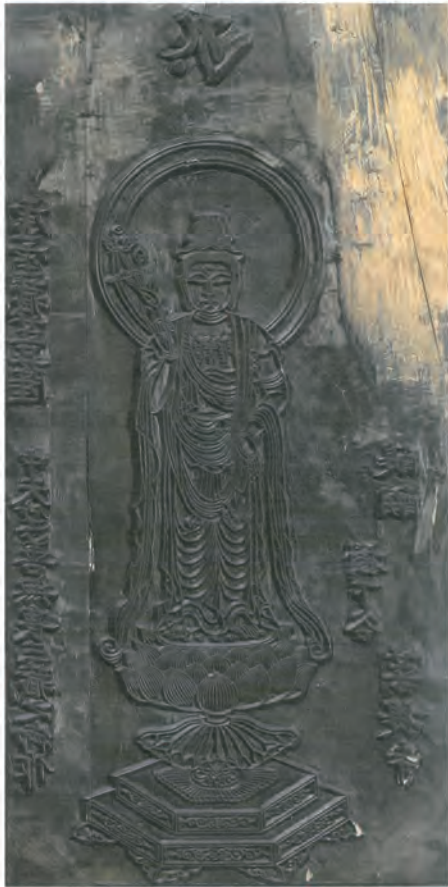
菩提寺虚空蔵菩薩像版木 江戸時代

平成27年(2015)、醍醐寺所蔵の重要文化財「聖観音菩薩立像」が、近年の調査と研究で尊名と伝来が判明し、あらたに「虚空蔵菩薩立像」として国宝指定されました。この像は、正しい尊名や伝来は不明ながら、明治42年(1909)に重要文化財として指定され、以後長らく、醍醐寺の聖観音像として知られてきたものです。