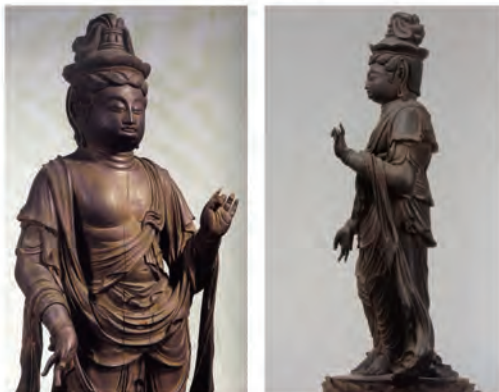
虚空蔵菩薩立像 平安時代

同時に、春の恒例、豊臣秀吉が催した「醍醐の花見」に関する展示を行います。蒔絵で桐紋をあらわした花見道具の品々や、秀吉から賜った金天目茶碗など、華やかな展示をお楽しみください。