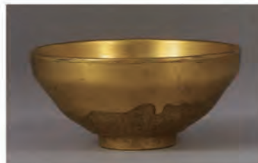
金天目茶碗 桃山時代